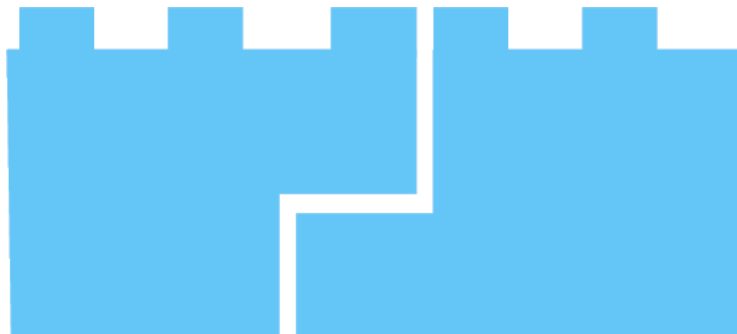
Corte perimetral y superficie